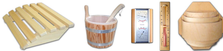
Abbildung evtl. ähnlich, je nach Angebot des Zubehör-Anbieters