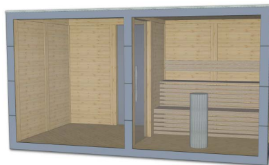
(2) Isolierglas 24 mm transparent