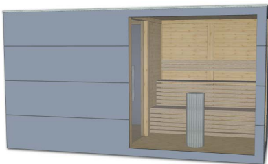
(1) Trespa-verkleidete Fassade wand als Wandsystem wie oben beschrieben